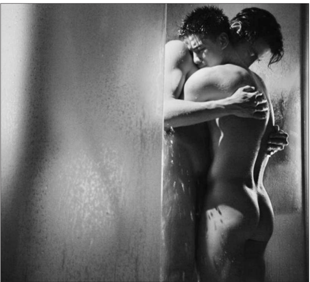
Кадър от Амфеталии

- О, невъобразимо! Когато видя филма, първата ми реакция е: "А какво ли ще кажат журналистите и критиците?". ( Смях ) Но моята работа всъщност е да привлече тяхното внимание най-вече по време на фестивалите - да опитват на прожекция, да напишат нещо (изобщо не е важно дали отзивите са положителни), да направят интервюта с режисьора или с други