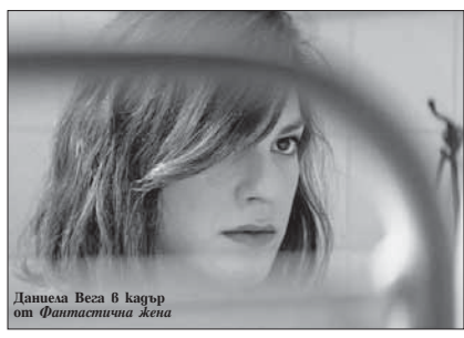
Даниела Вега в кадър от Фантасмична жена

3 март 2018 г. П.С. Юбилейното 90-то присъждане на „Оскар“ - най-шумната награда в света - се провежда на 4 март (5 март българско време) в Доли Пилър в Лос Анджелис с водещ отново Джими Кимъл. Церемонията попада в адекватна атмосфера на скандалаите за сексуален тормоз и фувкешето #MeToo, тръзнало от мащабния продуцент Харви Уайншtein, позубил карриерата на Кейви Спейси и пребриващи Джеймс Франко в най-големия зубещ с акламацията му филм „The Disaster Artist“, номиниран единствено за адаптиран сценарий. Разбира се, не мина без споменаването на Уайншtein, Тръмън и Путин. На 4 вечерта си спретнах собствено „раздаване“ на „Оскар“-и. Не позная единствено този на Роджър Пилл за оригинален сценарий на „Бязай“ - бях заохлана, естетически, на Мартин Макдона. Така че, по време на церемонията имахте съспенс, но само една изненада. 5 март 2018 г.